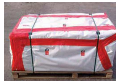
Palette filmée Amiante lié