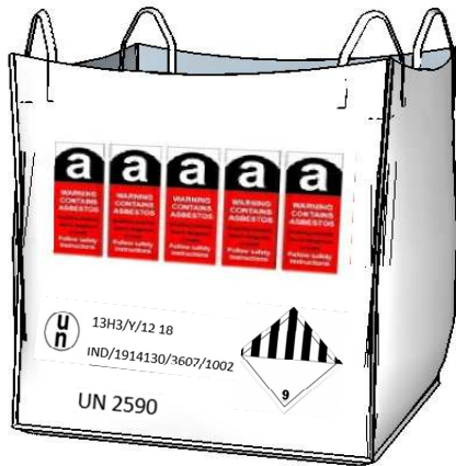
GRV 13H3Y pour colis d'amiante libre (scellé)