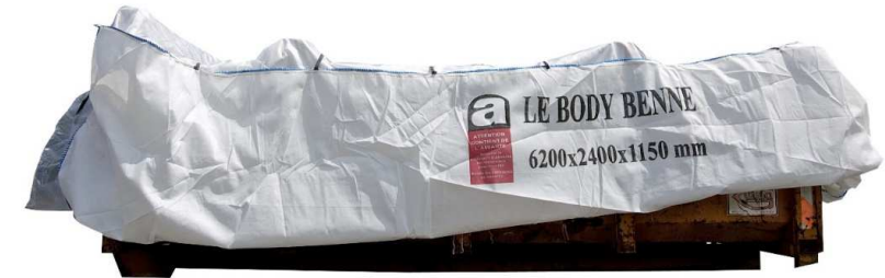
Dépôt benne Amiante lié