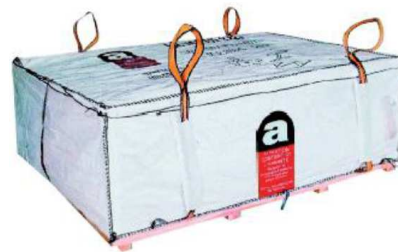
Dépôt bag Amiante lié